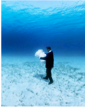
Exploration rationnelle des fonds sous-marins : la carte, Philippe Ramette Photographie, 2006

Philippe Ramette – Né en 1961. Vit et travaille à Paris. Est représenté par la Galerie Xippas (Paris).