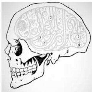
Ceux qui savent, ceux qui ne savent pas , Mounir Fatmi, Sérigraphie, 2005

Pour la première fois, un groupe d'étudiants se propose d'en être les programmeurs et d'y exposer un choix d'oeuvres d'artistes contemporains.