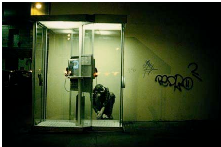
Cabines téléphoniques , Ernest Pignon-Ernest Photographie, 1996