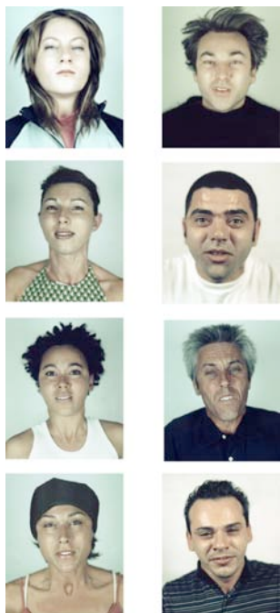
Palindrome Boys/Girls , Frédéric Lebain Photographies, 2002 Courtesy Galerie Philippe Chaume

La photographie témoin de cette opération de renversement, mise en scène par un jeu de miroirs lors de l'édition 2004 de la Nuit Blanche, soumet un groupe d'individus ordinaires à des effets d'apesanteur tout à fait inhabituels. Leurs postures, à la fois grotesques et composées, plaquent une autre réalité sur la façade de cet immeuble parisien.