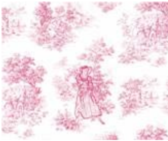
Shooting Wallpaper, Brigitte Zieger Film d'animation, 10', 2006

Cette vue sereine et improbable de l'artiste au fond de l'eau laisse envisager la possibilité d'un être au monde décentré. Faisant fi des lois de la pesanteur, l'artiste s'équipe de prothèses et de dispositifs qui lui font expérimenter les positions les plus irrationnelles . On croirait à un artifice complet si une irrépressible mèche de ses cheveux et la souplesse de la carte ne nous disait pas la réalité de cette situation burlesque.