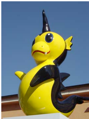
MocMoc, Com&Com DVD, 45', 2004