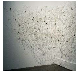
Vues de l'exposition Revers du Réel Galerie Michel Journiac, Paris, 2008