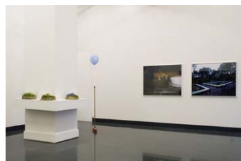
Vues de l'exposition A la limite , Galerie Michel Journiac, 2009